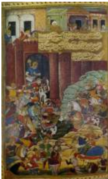
“Самарқанднинг Бобур томонидан қамал қилиниши”

Жамна дарёси ёқасидаги Агра шаҳрини янги империянинг пойтахти қилиб белгилайди. Бобур Хиндистон тахтида беш йилгина (1525 — 1530) ҳукмронлик қилди. У 1530 йил 26 декабрда 47 ёшида вафот этди, Аградаги Нурафшон боғига дафи этилди. Бир қанча вақтдан кейин, васиятига биноан, унинг жасади Қобулга кўчирилиб, Боғи Бобурга қўйилди. Шундай қилиб, Бобурийлар Хиндистонда 300 йил ҳукмронлик қилдилар.