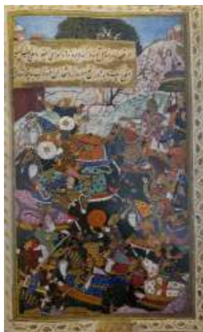
“Бобирнинг Танбалга қарши Бишхорон қўрғонидаги жанги”