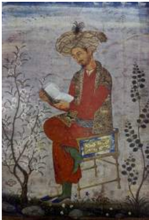
“Заҳириддин Муҳаммад Бобур”. XVII аср бошида ишланган миниатюра

Ўрта Осиё халқларидан етишиб чиққан буюк тафаккур эгаларининг бутун бир плеядаси худди шу даврда яшаб, ижод этди. Бутун дунёга номлари машхур тарихчилар: Шарафиддин Али Яздий, Иби Арабшоҳ, Мирхонд, Хондамир, Давлатшоҳ Самарқандий; олимлар: Улуғбек, Али Қушчи, Қози-зода Румий; файласуф-шоирлар: Абдурахмон Жомий, Алишер Навоий, Лут-фий, Саккокий, Атоий; рассомлар: Беҳзод, Қосим Али, Мирак Наққош, Махмуд Музаҳҳиб; хаттотлар: Султонали Машҳадий, Султон Муҳаммад Хандон, Муҳаммад бин Нур, Дарвеш Муҳаммад Токий ва жуда кўп бошқа шахслар шулар жумласидандир [1].