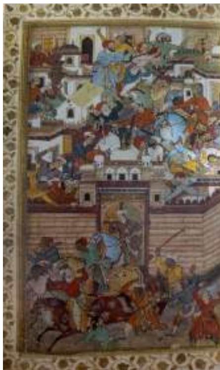
“Бобурнинг Андижон атрофидаги жанги”

Шундан сўнг Бобур ўзига содиқ бўлган бир гуруҳ кўшини ва қариндошлари билан Қобул томонга йўл олади. Бу воқеани Бобурнинг кизи Гулбаданбегим ўзининг машҳур «Хумоюннома» асарида куйидагича баён қилган: «Тўлиқ ўн бир йил давомида, Мовароуннаҳр ўлкасида чиғатой султонлари билан шундай жанглар ва мудофаалар қилдиларки, уларнинг сонини тўла баён қилишга қалам тили ожиз ва нуқсонлидир... Икки юз киши пиёда, елкаларида чопон, оёқларида чорик, қўлларида таёқ бўлгани ҳолда, беяроқ, Худога таваккал қилиб, Бадахшон ва Қобулга қараб йўл олдилар» [5].