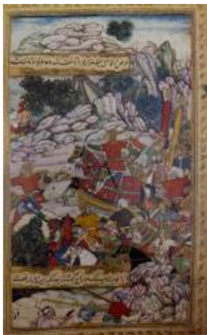
“Бобир Дашт қишлоғини ишғол қилмоқда”

Ушбу кўпфигурали миниатюрада Бобурнинг ҳазорийларни тоғ томон қувиб бориб, улар билан олиб борган жанг сахнаси тасвирланган. Композицияда бир нечта қилич ва қалқон тутган отлиқ ва пиёда аскарлар ҳамда ярадорлар акс эттирилган. Миниатюра совуқ ва иссиқ рангларнинг ўзаро номуносиблиги асосида чизилган. Мовий тоғ тизмаси, ярим сарик рангдаги қуёш ҳамда тўқ ва оч яшил дарахтларнинг тасвирланиши воқеанинг илиқ куннинг кундуз қисмида бўлётганидан дарак беради.