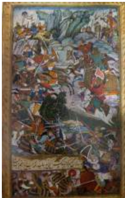
“Андижон яқинидаги Чиглдухтаронда жанг”

XI – XV асрлар давомида яратилган, пальма баргларига битилган қатор диний китобларни ҳам расмлар билан зийнатлаш одат бўлган. Ҳатто Бобурийлар империяси бунёд этилгунга қадар Деҳли, Гужорат ва Бенгалияда яратилган турли расмли қўлёзмаларнинг бир нечтаси сақланиб қолган. Аммо бу миниатюра расмлар асосан кичик маданий марказларда яратилган бўлиб, ўзининг соддалиги, композициясининг шартлилиги, кам ранглардан фойдаланилганлиги ва чизиқларнинг нисбатан дағаллиги билан характерланади.