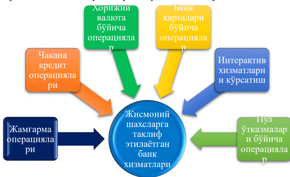
1-расм. «Ҳамкорбанк» АТБ томонидан жисмоний шахсларга таклиф этилаётган хизматларнинг гуруҳланиши

Бу борада, «Ҳамкорбанк» АТБ томонидан жисмоний шахсларга кўрсатилаётган хизматлар олтига йўналишни камраб олади (1-расм). Улар жамғарма (аҳоли пул маблағларини банк депозитларига жалб қилиш); чакана кредит (ипотека, автокредит, истеъмол кредити, овердарафт ва бошқалар); хожий валюта операциялари (конверция, инкассога қабул қилиш, трансчегаравий ўтказмалар); банк карталари (муомалага чиқариш, картадан картага пул ўтказмалари, хорижий банк карталари эквайринги ва бошқалар); интерактив хизматлар (интернет-банкнинг, SMS-Banking, QR код орқали операцияларни амалга ошириш ва бошқалар); пул ўтказмалари (хорижий валютадаги пул ўтказмалари, ички банк пул ўтказмалари, SWIFT тизими орқали тўловлар, GPI глобал тўлов тизими ва бошқалар).