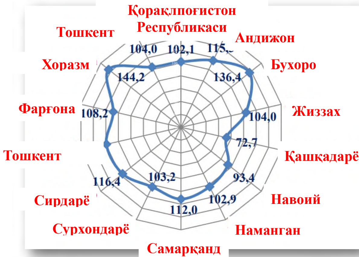
2-расм. Асосий капиталга ўзлаштирилган инвестицияларнинг ўсиш суръатлари фоизда [7].

Инвестицион фаолликнинг энг паст ўсиш суръатлари Қашқадарё – 72,7 фоиз (инвестиция ҳажми 16 225,1 млрд. сўм) ва Навоий – 93,4 фоиз (16 309,1 млрд. сўм) вилоятларида қайд этилди. 2021- йилда жами асосий капиталга ўзлаштирилган инвестицияларнинг асосий қисми, яъни 63,2 фоизи республиканинг олти ҳудудида, жумладан, Тошкент шаҳрида – 23,5 фоиз, Тошкент вилоятида – 11,4 фоиз, Бухоро вилояти – 7,8 фоиз, Самарқанд вилояти – 7,2 фоиз, Навоий – 6,7 фоиз ва Қашқадарё вилоятида – 6,6 фоиздан инвестициялар ўзлаштирилди. 2021 - йилда аҳоли жон бошига ҳисобланган асосий капиталга ўзлаштирилган инвестициялар ҳажми бўйича юқори кўрсаткичлар Тошкент шаҳрида – 20 433,9 минг сўм (ёки 2020 - йилга нисбатан таққослаганда – 97,4 фоиз), Навоий вилоятида – 15 931,5 минг сўм (ёки 91,7 фоиз), Сурхондарё вилоятида – 10 011,5 минг сўм (ёки 114,3 фоиз), Бухоро вилоятида – 9 681,7 минг сўм (ёки 134,6 фоиз), Тошкент вилоятида – 9 538,7 минг сўм (ёки 120,4 фоиз) ва Қашқадарё вилоятида 4 811,9 минг сўм миқдорида (ёки 71,4 фоиз) қайд этилди.