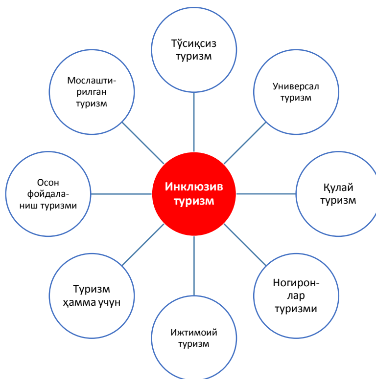
1-расм. Инклюзив туризмга ўхшаш турли адабиётларда учраши мумкин бўлган терминлар

Инклюзив туризмга ўхшаш атамалар жуда кўплаб манбалар ва адабиётларда турли даража ва қамровдаги туризм сегментини ўз ичига олишига кўра бир неча хил номлар билан аталган ( 1-расмга қаранг ).