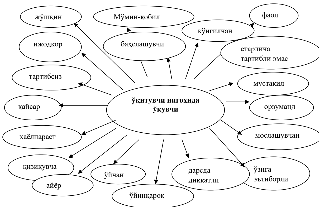
1-rasm. O'qituvchi nigohida maktab o'quvchisi.

Tadqiqotda respondent sifatida turli fanlardan dars beruvchi umumiy o'rta ta'lim maktablari o'qituvchilari jalb etildi. Ulardan “Hozirgi maktab o'quvchisi” tushunchasiga nisbatan erkin shaklda klaster tuzish so'raldi. Olingan javoblar umumlashtirilib, mazmunan ijtimoiy-psixologik xususiyatlarni aks ettiruvchi tasavvurlar tizimlashtirildi.